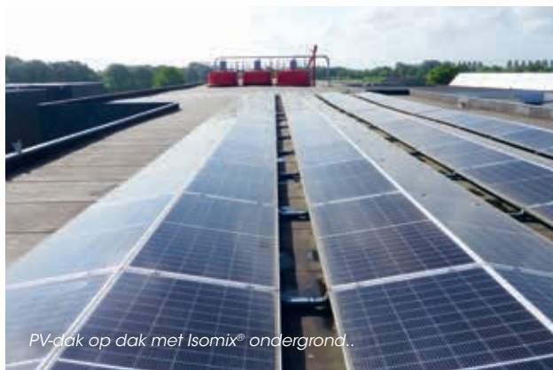
PV-dak op dak met Isomix® ondergrond..

Doordat het een flexibele mortel is, kunnen we probleemloos oneffenheden opvangen. Alle hoeken en gaten zijn bereikbaar. Een eigenschap die we voor hebben op bijvoorbeeld stuggere isolatieplaten. Je hebt in principe een waterpas dak nodig om die isolatieplaten goed te plaatsen. De aannemer moet vlinderen en van alles uit de kast halen voordat hij de isolatieplaten kan plaatsen. Bij Isomix® hoeft